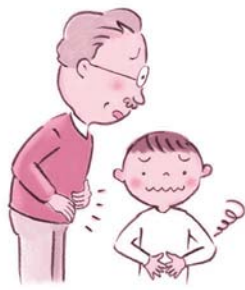
おなかに不快感のある方に