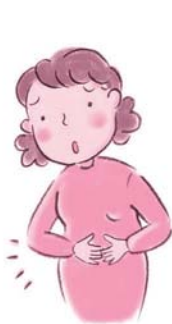
おなかのはる方に